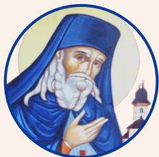
Sfântul Iosif de la Vărativ

Fie ca rugăciunile celor doi Sfinți ale căror sfinte moaște se află la Mănăstirea Vărativ, Sfântul Iosif și Sfântul Gheorghe Pelerinul să fie roditoare în sufletele celor care calcă pragul acestei binecuvântate mănăstiri