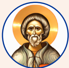
Sfântul Gheorghe Pelerinul