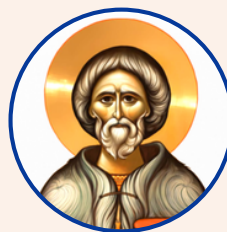
Sfântul Gheorghe Pelerinul