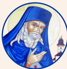
Sfântul Iosif de la Văratice

Fie ca rugăciunile celor doi Sfinți ale căror sfinte moaște se află la Mănăstirea Văratice, Sfântul Iosif și Sfântul Gheorghe Pelerinul să fie roditoare în sufletele celor care calcă pragul acestei binecuvântate mănăstiri